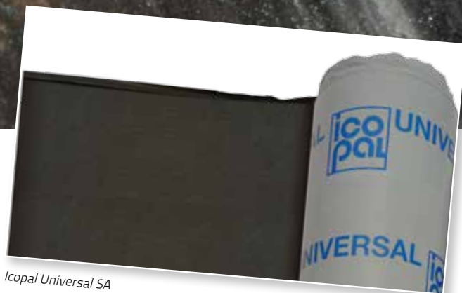
Icopal Universal SA