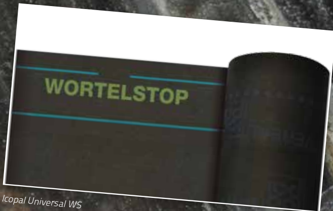
Icopal Universal WS